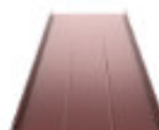
Classic C Classic Design C