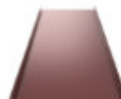
Classic D Classic Design D