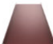
Classic M Classic Design M

Vytváří hladký povrch s drážkami, skrytými spojovacími prvky a složeným předním okrajem, což z něj dělá elegantní volbu pro celou řadu architektonických stylů.